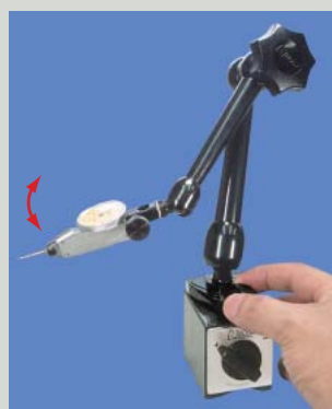
ワンタッチ手元微動送り機構 アームに触れずにゲージ針を微動送りさせるので、0合わせが簡単です