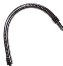
ML0020 ¥3,000 拡大鏡用フレキシブルホース 315mm長さ。

*LED付拡大鏡の価格体系は他のノガ製品の価格体系と全く異なりますのでご注意ください。