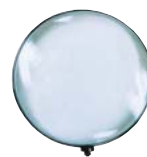
ML0010 ¥3,600 φ100mm×2倍シングルレンズ