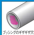
プッシングのギザギザ穴