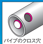
パイプのクロス穴