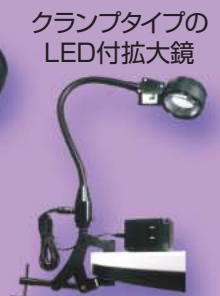
LED5000C ¥24,000 (LED 1灯付)

ノガ・ジャパンのLEDスタンドは、すべてAC100V電源で使用できますので、バッテリー切れなどを心配せずに安心してご利用いただけます。強力なオンオフマグネット付ですので、手軽に鉄製の器具に固定できます。LED1000及びLED2000は1灯あたり0.1W、LED3000及びLED5000は1灯あたり1Wの微量の消費電力です。